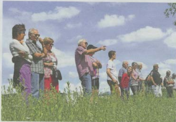
Die Zuschauer verfolgten das Geschehen auf dem Fluss mit Spannung.