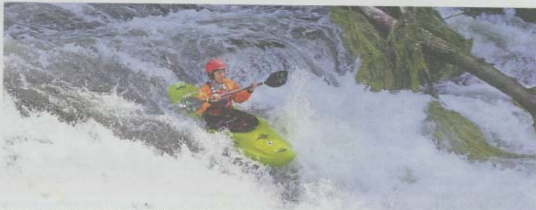
Die Kanuten boten zum Teil spektakuläre Wildwasserfahrten.